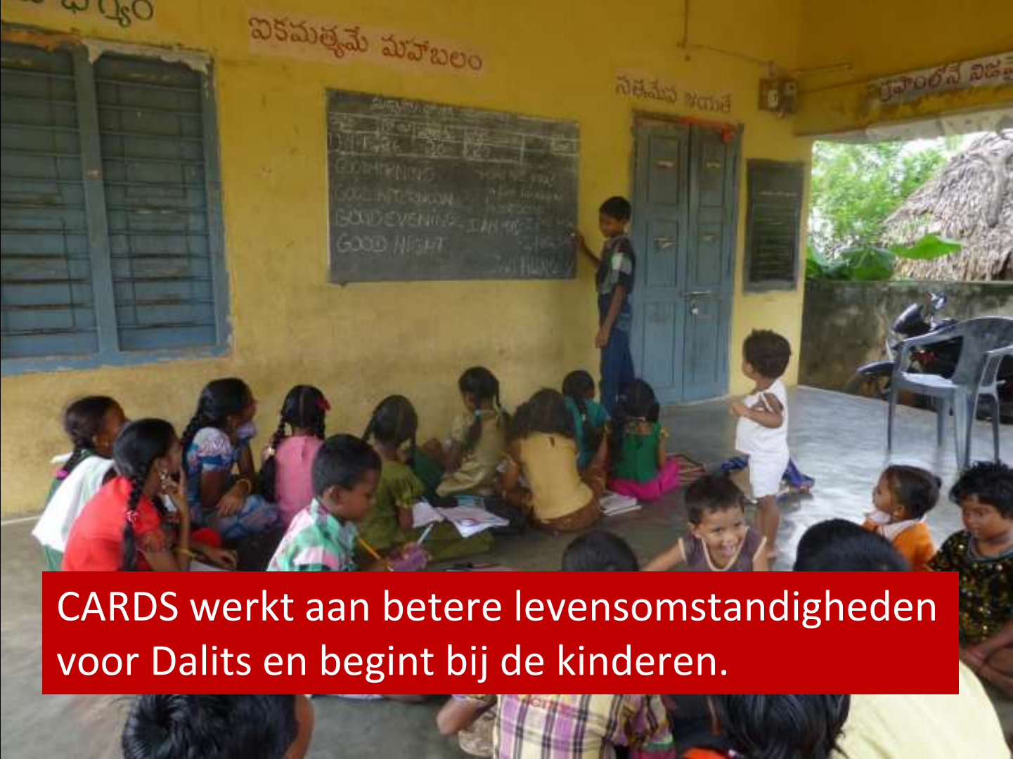
CARDS werkt aan betere levensomstandigheden voor Dalits en begint bij de kinderen.