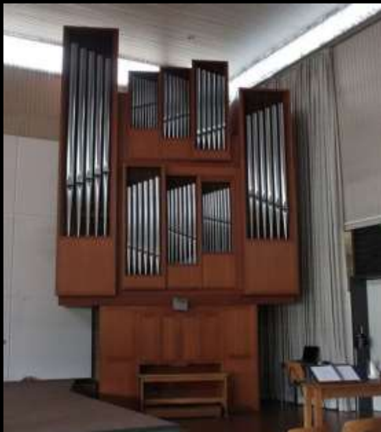
Orgelspel door Ineke ten Brug